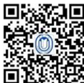
上海大学 本科招生