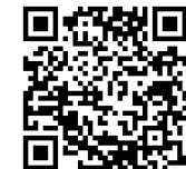
上海大学 PIM 系统