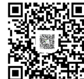
上海大学 海外实习网