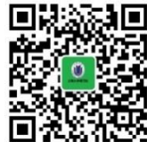
上海大学 安全保卫